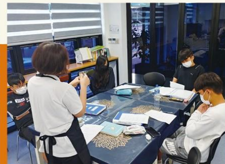
시험 전 주의사항 알리기