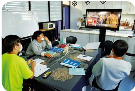
다양한 미디어보기 영화감상