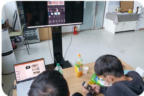
자원봉사 겸 사진동영상 만들기