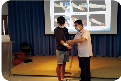
응급구조 체험과 여름 안전교육