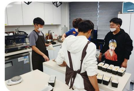
맛있는 빵을 만드는 제과제빵