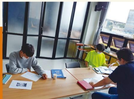
자율학습시간에도 바리스타 공부