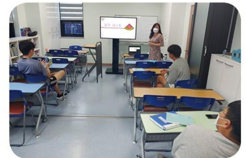
각종직업과 성격을 알아보는 진로와직업