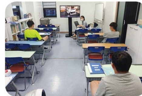
눈으로 보고 체험하는 과학