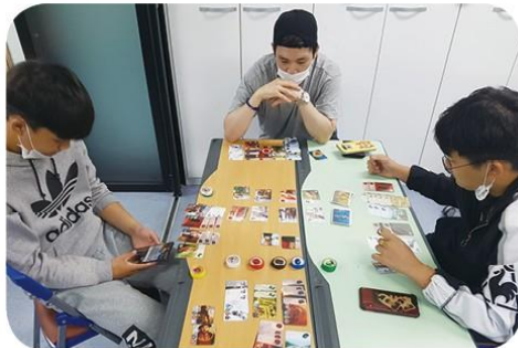
두뇌 플레이 보드게임