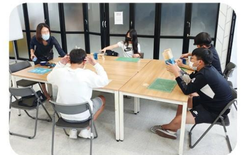
각종 가구를 만드는 시간노작