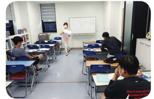
가장 어려운 과목이 쉬어진다 수학