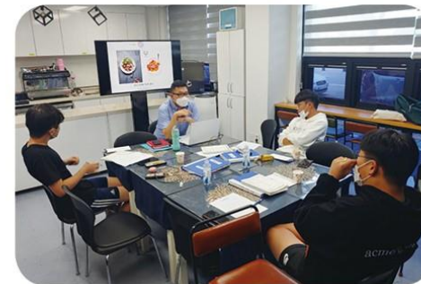
사진 찍고 영상을 촬영하는 사진영상편집