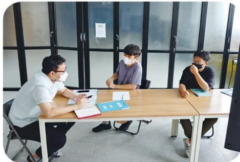
학교생활 나의 의견 말하기 자치회의