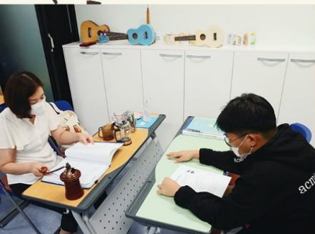
1:1 바리스타 수업