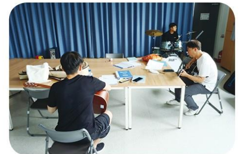
악기를 배우는 실용음악