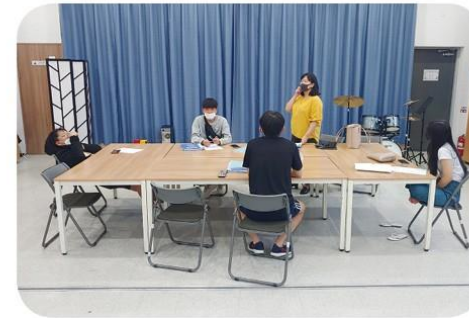
즐거운 토론회 국어