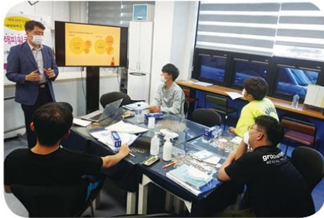
근로 중 자신을 지키는 방법 인권교육