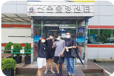
몸도 마음도 신나는 볼링활동