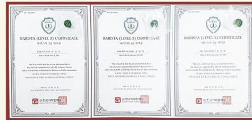
바리스타 3급 자격증 취득

2020년 1월 코로나19 확산으로 많은 외부활동이 멈추어지고 바리스타 2급 필기시험 일정도 미루어지는 악조건에서 바리스타 3급 자격증을 취득할 수 있게 되었습니다. 아이들도 어려운 상황에서 바리스타 3급을 취득하기 위해서 열심히 공부하고 틈틈이 개인공부와 쪽지시험을 보았습니다. 이에 바리스타 3급을 취득하게 되었습니다.