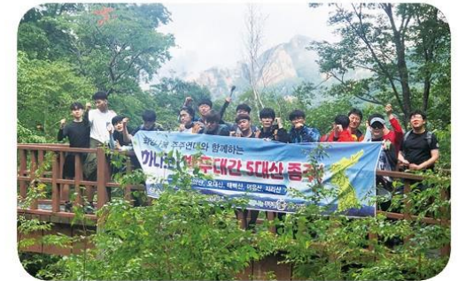
희망나눔후원_5대산 종주(설악산 등산)