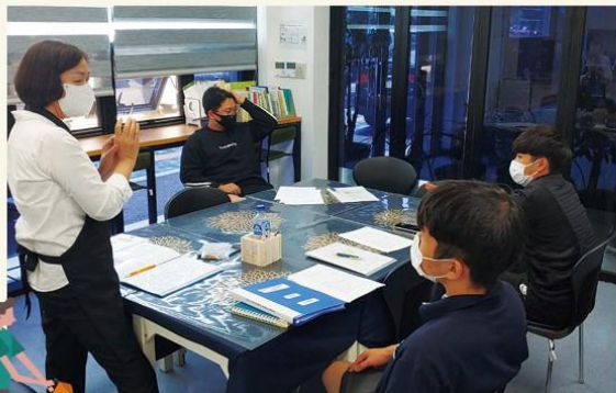
바리스타 이론 수업